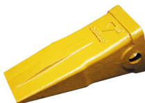
Усиленная коронка NBLF

2. Усиленные коронки похожи на стандартные, но масса их чуть больше. Применяются также на легких породах, но с большей абразивностью и имеют более длительный срок службы, чем стандартные. К недостаткам также следует отнести большую остаточную массу и плохое внедрение в грунт.