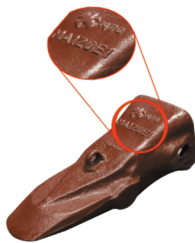
Фирменная коронка MTG

Внимание! На поддельной коронке не указывается бренд, обозначается только каталожный номер.