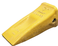
Стандартная коронка NBLF

1. Стандартные коронки подходят для общеземляных работ и, как правило, устанавливаются на навесное оборудование новой техники. Данные коронки используются в работе на легких земляных породах, где нет сильного истирания. Основное преимущество стандартных коронок - низкая стоимость, однако следует учитывать их недолгий срок службы, большую остаточную массу и плохое внедрение в грунт, обусловленное конструкцией.