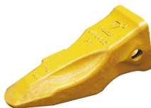
Коронка NBLF для фронтального погрузчика

4. Коронки для ковшей фронтального погрузчика имеют форму башмачка. Поскольку в процессе работы фронтального погрузчика наибольшая нагрузка идет на нижнюю часть ковша, то основная масса таких коронок также сосредоточена снизу.