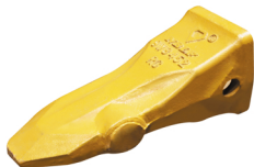
Скальная коронка NBLF

3. Скальные коронки имеют форму пики, они всегда остаются острыми, даже в ходе истирания, благодаря ребру жесткости, предусмотренному конструкцией коронки. Если в работе на скальных породах поставить на ковш стандартные коронки, то при истирании они быстро станут тупыми, их придется часто менять, что приведет к простоям и, как следствие, убыткам.